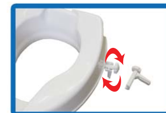
Loosening and securing the toilet raiser is done by loosening or tightening the screws on the mounting brackets.

Check that the raiser is firmly in place. The toilet raiser is ready for use.