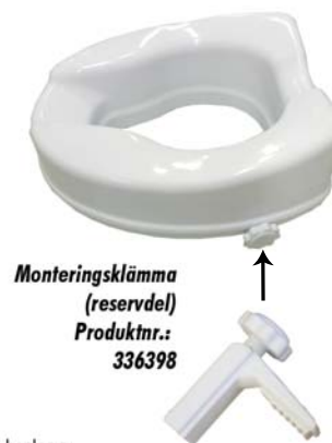
Monteringsklämma (reservdel) Produkt nr.: 336398