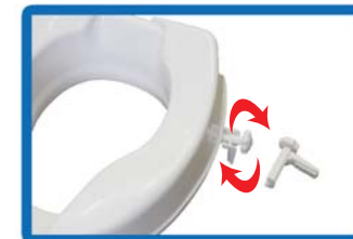
WC-korottajan irrotus ja kiinnittäminen tapahtuu löysäämällä tai kiristämällä kiinnitystallojen ruuveja.

Tarkista, että korottaja on tukevasti paikoillaan. WC-korottaja on käyttövalmis.