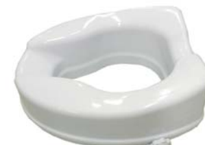
Varaosat, L-talla Tuotekoodi: 336398