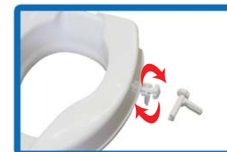
Lossning och fastgörning av höjaren görs genom att lossa eller dra åt skruvarna på fästena.

Kontrollera att höjaren är ordentligt på plats. Höjaren är klar för användning.